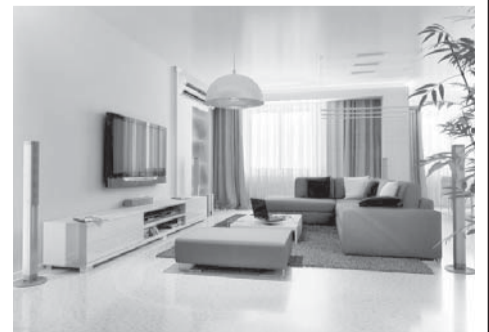
В конкурсе уже участвует Архитектурная студия S.W., представившая на суд жюри дизайн проект квартиры в кирпичном доме на «Тополиной аллее»