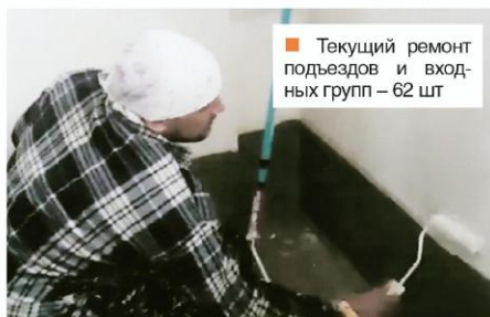
■ Текущий ремонт подъездов и входных групп — 62 шт