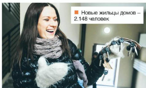
■ Новые жильцы домов — 2.148 человек