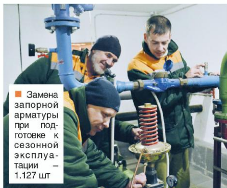
■ Замена запорной арматуры при подготовке к сезонной эксплуатации — 1.127 шт